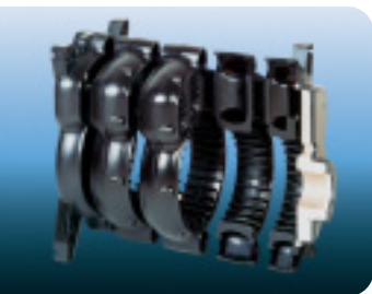
Schnitt durch die moderne Gusskonstruktion des F 110 NT.

Die neueste Generation der bewährten Öl/Gas-Spezial-Guss-Heizkessel von Rapido fürs Ein- oder Mehrfamilienhaus verkörpert der F 110 NT. In ihm vereint sich jahrzehntelange Erfahrung mit modernster Technologie und elegantem Design zu einem Hightech-System, das Maßstäbe setzt. Mit seinen sieben Leistungsstufen von 16 bis 70 kW können Sie den F 110 NT optimal auf Ihren speziellen Bedarf abstimmen. Dass der Kessel sehr leise arbeitet und bei normaler Wartung völlig störungsfrei läuft, versteht sich bei Rapido von selbst. Und mit dem umfangreichen Zubehörprogramm können Sie den F 110 NT zur universellen Heizzentrale für Ihr Haus ausbauen. So nutzen Sie wohlige Wärme und warmes Wasser, wann und wo Sie es wünschen.